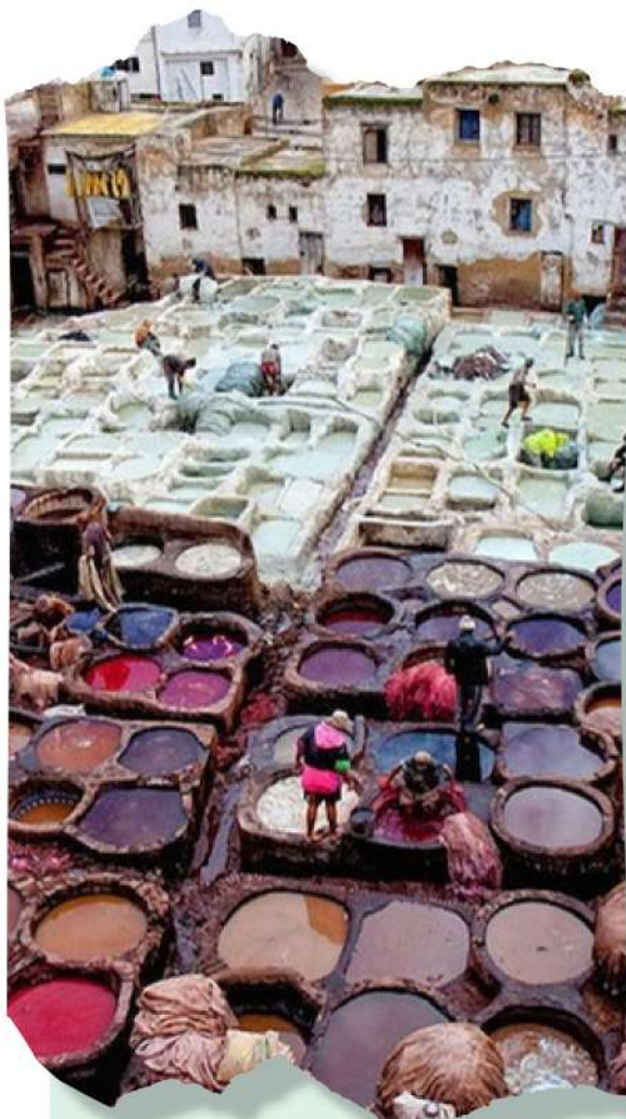
Image : La tannerie Chouara, la plus ancienne tannerie de cuir du monde, située au cœur de la médina de Fès.