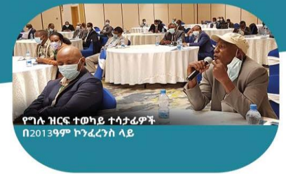
የግለ ዘርፍ ተወካይ ተሳታፊዎች በ2013ዓም ኮንፈረንስ ላይ